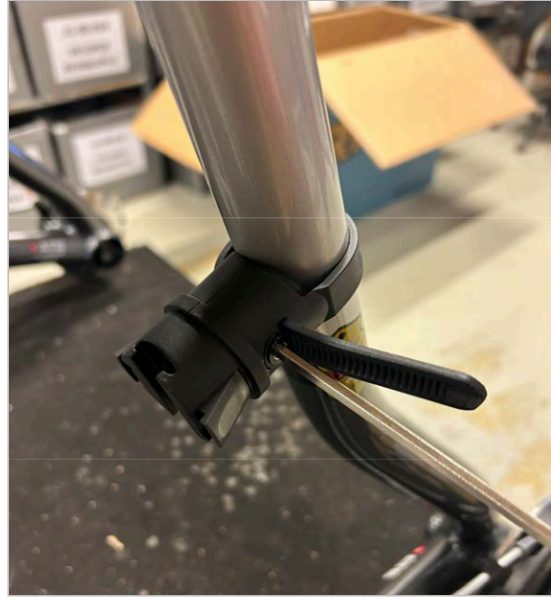
⑥ Serrer la vis/sangle à l'aide de la clé allen de 4 mm jusqu'à ce que la sangle soit bien serrée.