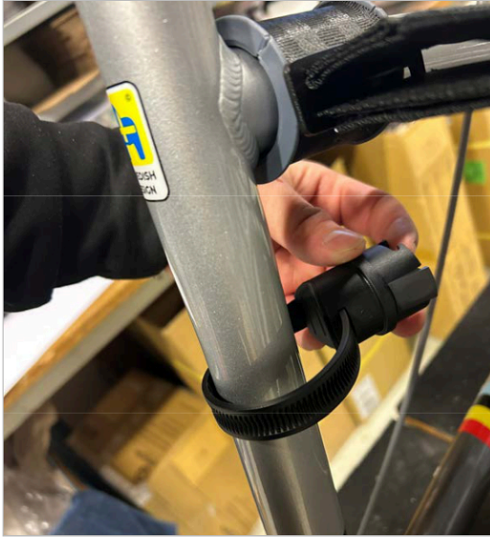
⑤ Insérez l'extrémité de la sangle dans le support.